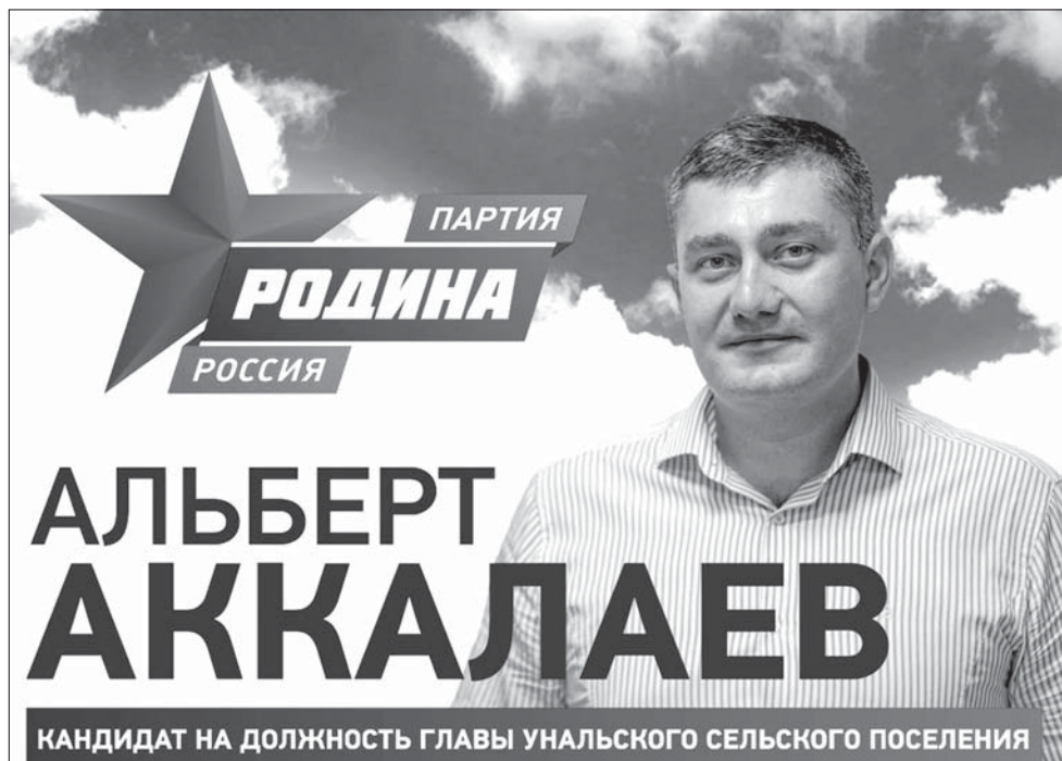
КАНДИДАТ НА ДОЛЖНОСТЬ ГЛАВЫ УНАЛЬСКОГО СЕЛЬСКОГО ПОСЕЛЕНИЯ

Материал предоставлен Алагирским местным отделением ВПП «Единая Россия». (Печатается на бесплатной основе)